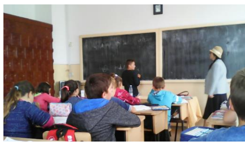
Adviseren op scholen,