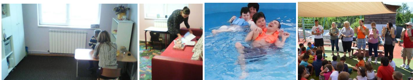
Eigen psychologie praktijken in Iași, plezier in ons overdekt zwembad, programma met vrijwilligers uit USA

In de herfst van 2016 is dit centrum omgebouwd tot twee individuele, zelfstandige psychologie-praktijken, waar de psychologen, die voorheen aan de stichting verbonden waren, nu hun specialistische werk zelf voortzetten voor kinderen met autisme, alsook voor hun families. Momenteel functioneren ze al meer dan een jaar tot ieders tevredenheid en daar zijn we erg blij mee!