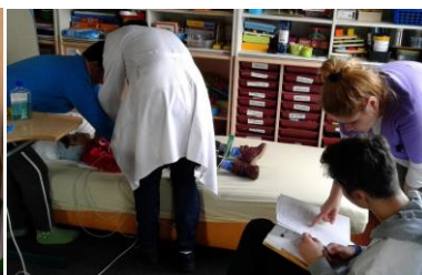
Medische en juridische Consultaties