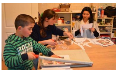
Activiteiten van aangepast werk