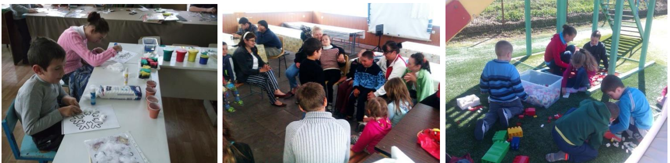
Evenementen voor kinderen met een beperking en hun brussen, familie en vrienden in de verschillende projecten