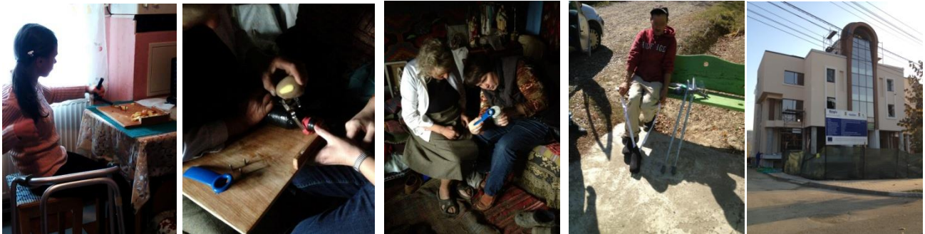
Ergotherapie: aanpassingen aanbieden om b.v. te koken of je aan te kleden, sociale dienstencentrum te Tg. Frumos